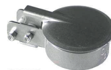
P.S.C Parapioggia silenziato