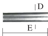
TUD tubo diritto